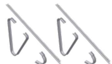
Bodenaufsteller-Set (SKW/BA) für Quermontage inkl. Backrails